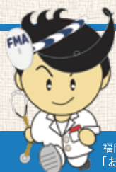
福岡市医師会 「おっしょ医くん」