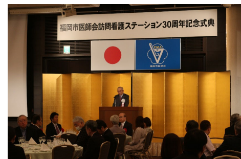
訪問看護ステーション 30周年記念式典