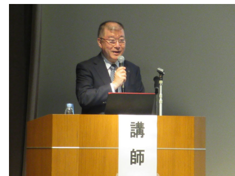
「第21回新しい医療講演会」