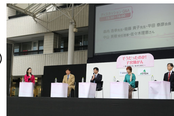
「そうだったのか！子宮頸がん」