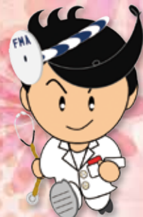
福岡市医師会 マスコットキャラクター 「おっしょ医くん」