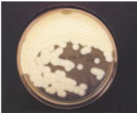
MRSA選別分離培地培養2日目

methicillin resistant Staphylococcus aureus ：MRSA