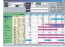
検査データの経時的表示